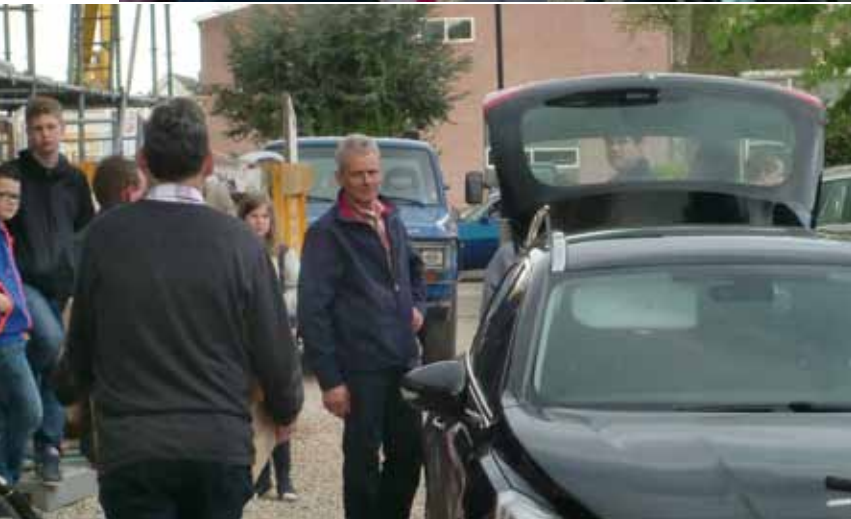
...Een wagen volgeladen...