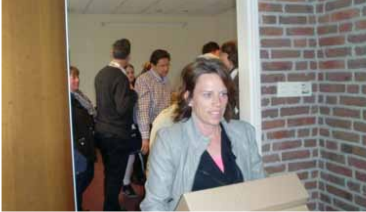
...Klaar voor de start