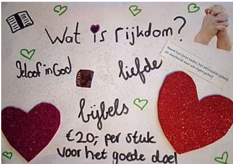
Gemaakt door zondagsschool A (basisschool groep7-8), n.a.v. het verhaal de rijke dwaas Lukas 12: 13-21