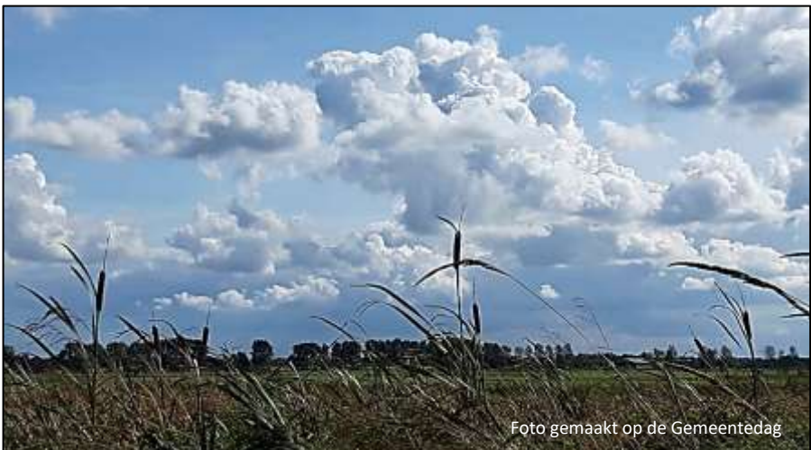
Foto gemaakt op de Gemeentedag